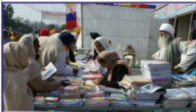
ਆਤਮ ਮਾਰਗ ਸਟਾਲ ਦ੍ਰਿਸ਼ (ਧਮੋਟ)