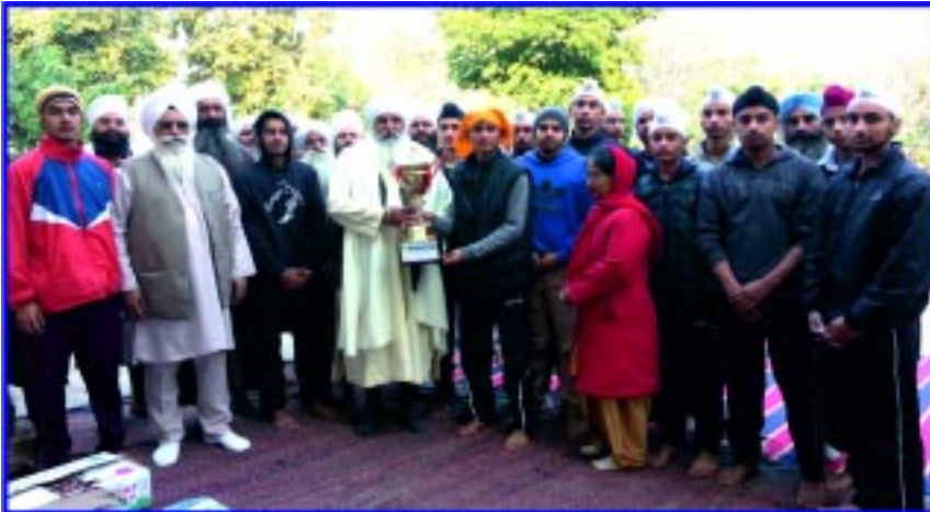
ਸਕੂਲ ਦੀ ਹਾਕੀ ਟੀਮ ਨੂੰ ਨਾਨਕ ਦੇਵ ਯੂਨੀਵਰਸਿਟੀ ਅੰਮ੍ਰਿਤਸਰ ਵਿਖੇ ਮਹਾਰਾਜਾ ਰਣਜੀਤ ਸਿੰਘ ਗੌਲਡ ਕੱਪ ਅਤੇ ਟਰਾਫੀ ਪ੍ਰਾਪਤ ਕਰਨ ਉਪਰੰਤ ਬਾਬਾ ਜੀ ਨਾਲ ਰਤਵਾਤਾ ਸਾਹਿਬ ਵਿਖੇ